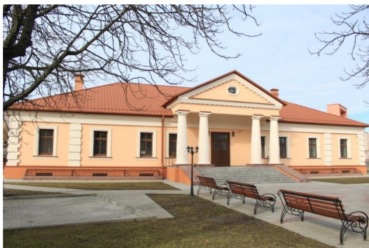
Фото 3. Здание Дворянского собрания – Слуцкий краеведческий музей, памятник архитектуры XVIII века