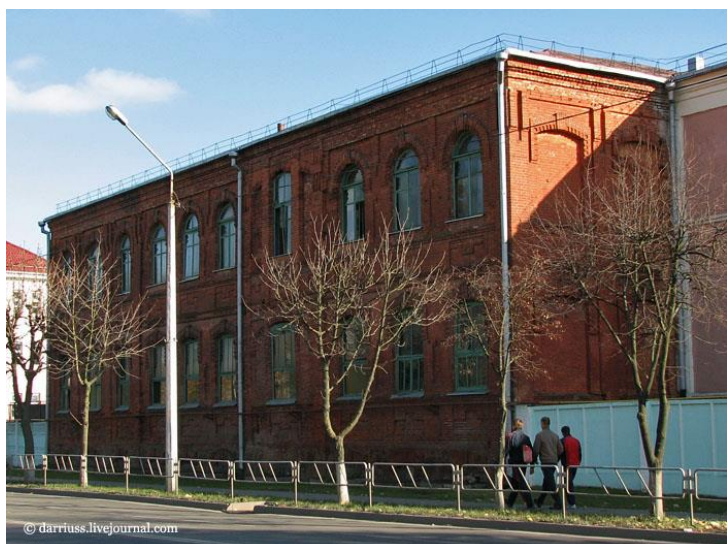
коммерческого училища, памятник архитектуры XIX века