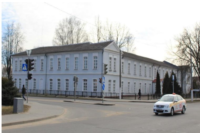
Фото 2. Здание Слуцкого духовного училища – Слуцкий государственный медицинский колледж, памятник архитектуры XIX века