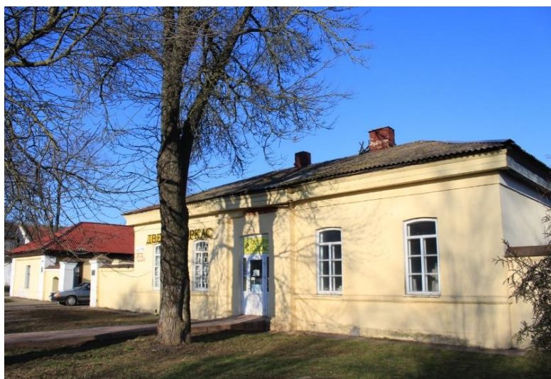
Фото 6. Здание почтовой станции, памятник архитектуры XIX века