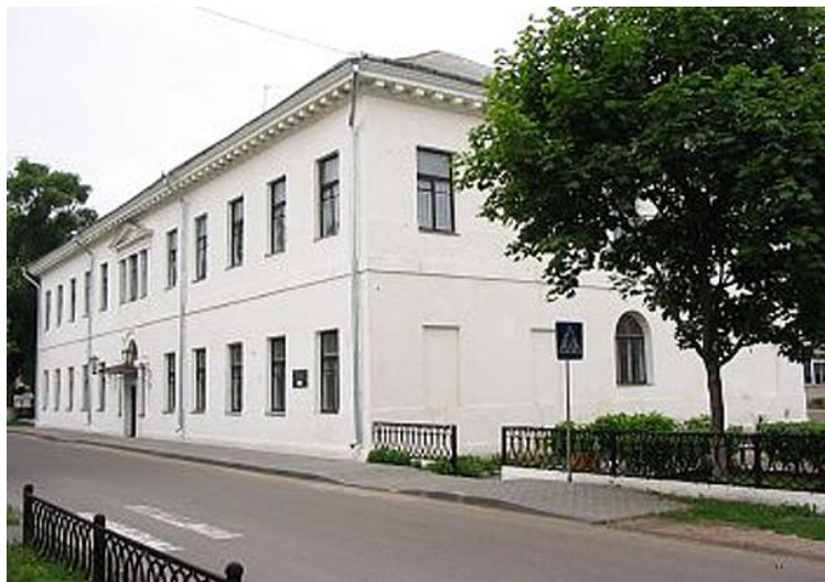
Фото 1. Здание старейшей школы Беларуси – Слуцкая гимназия № 1, памятник архитектуры XIX века