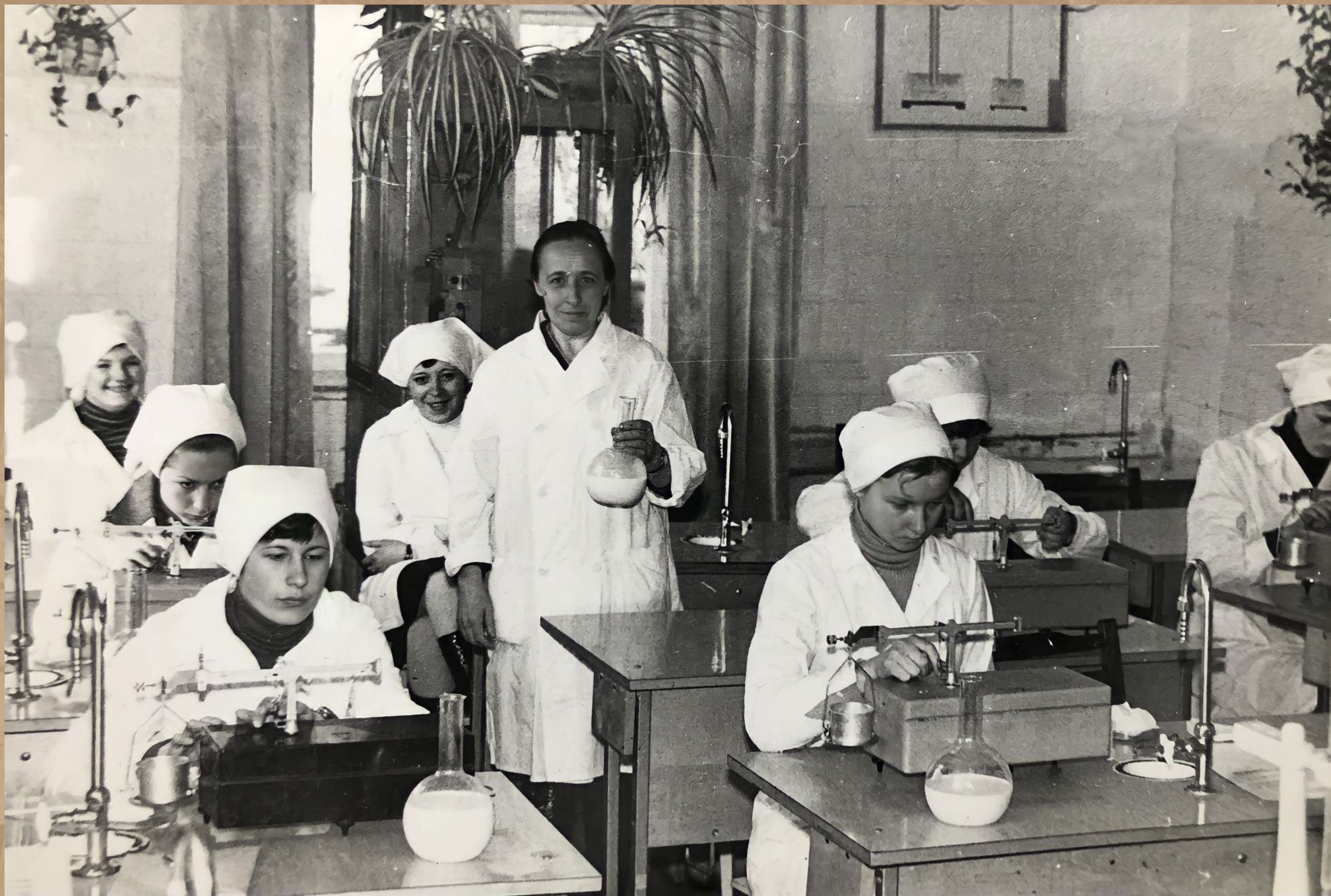
Будущие лаборанты химико-бактериологического анализа