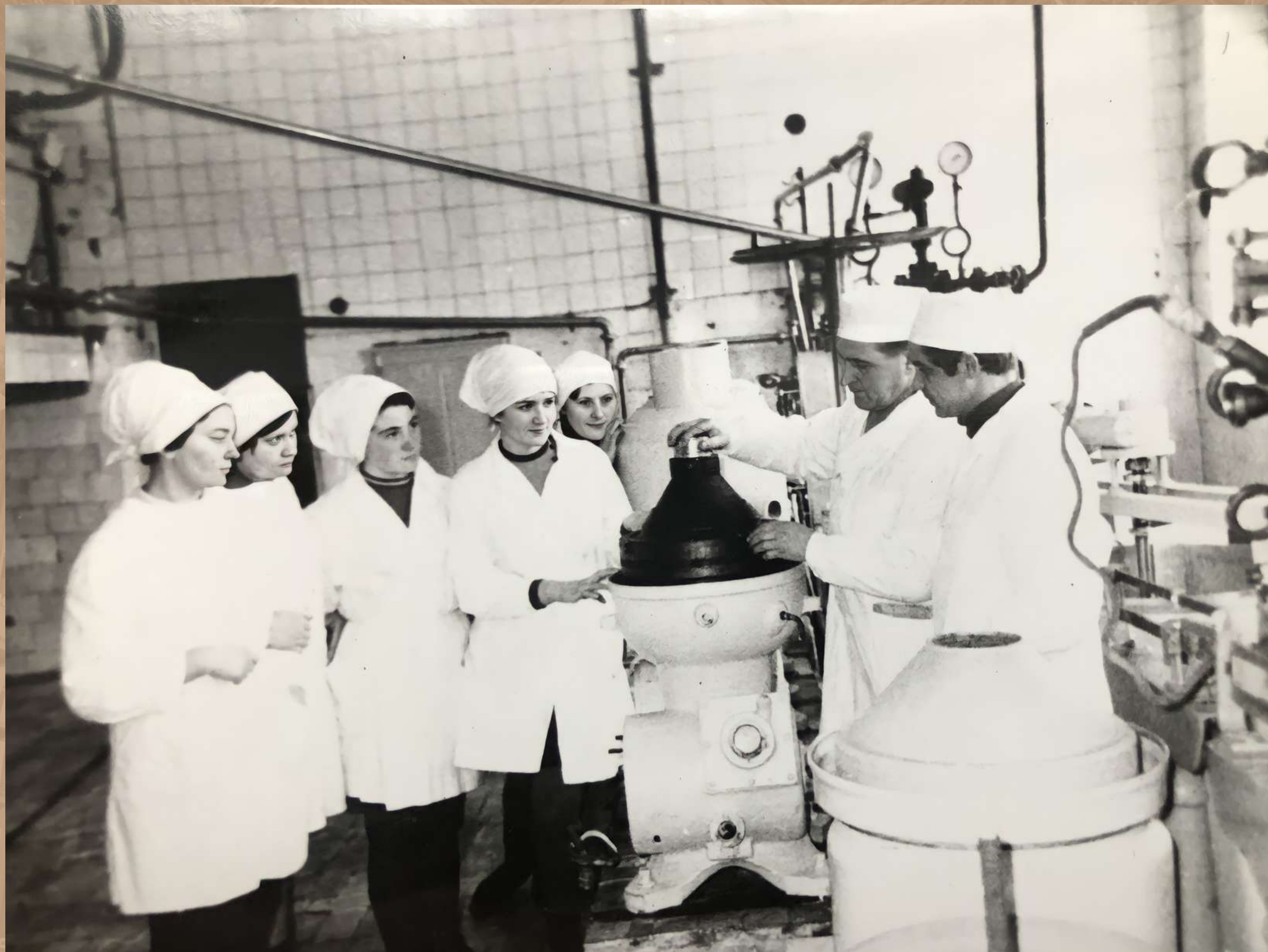
Будущие аппаратчики молочной промышленности