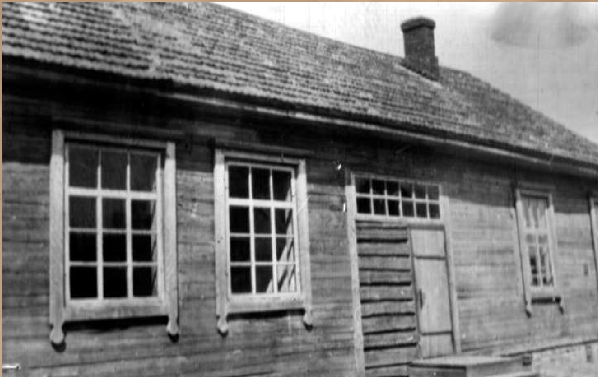
Учебный корпус, 1948 г.